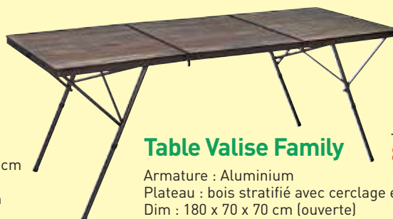
Table Valise Family

Armature : Aluminium Plateau : bois stratifié avec cerclage en aluminium Dim : 180 x 70 x 70 cm (ouverte) Dim : 72 x 11 x 62 cm (pliée) Poids : 7.6 kg - Charge maxi : 30 kg (réf : M/M045W71)